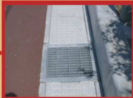
側溝にピッタリのマスへ