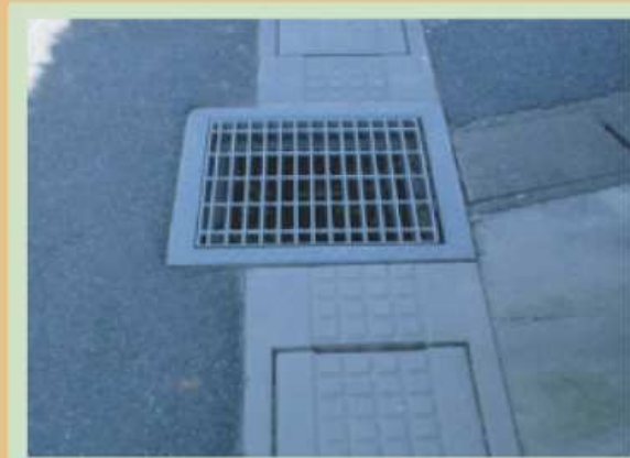
側溝からはみ出したマスから