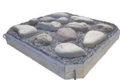
標準タイプ(玉石植石仕様)