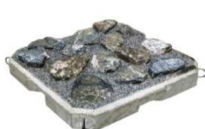
標準タイプ(割石植石仕様)