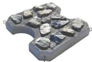
緑化タイプ(割石植石仕様)