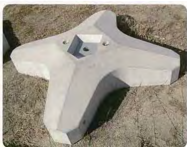
クロスタイプ ▶ KC-240-4