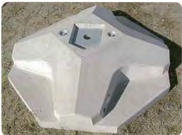
◀ オクトタイプ KO-190-4