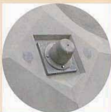
アンカー支圧面の水切り処理