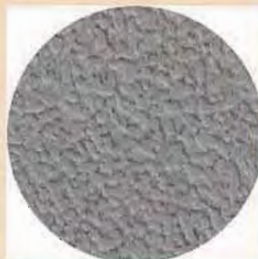
コンクリート面の粗面処理